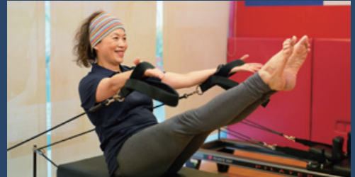
課堂收費 (每位) Class Fee (per person)